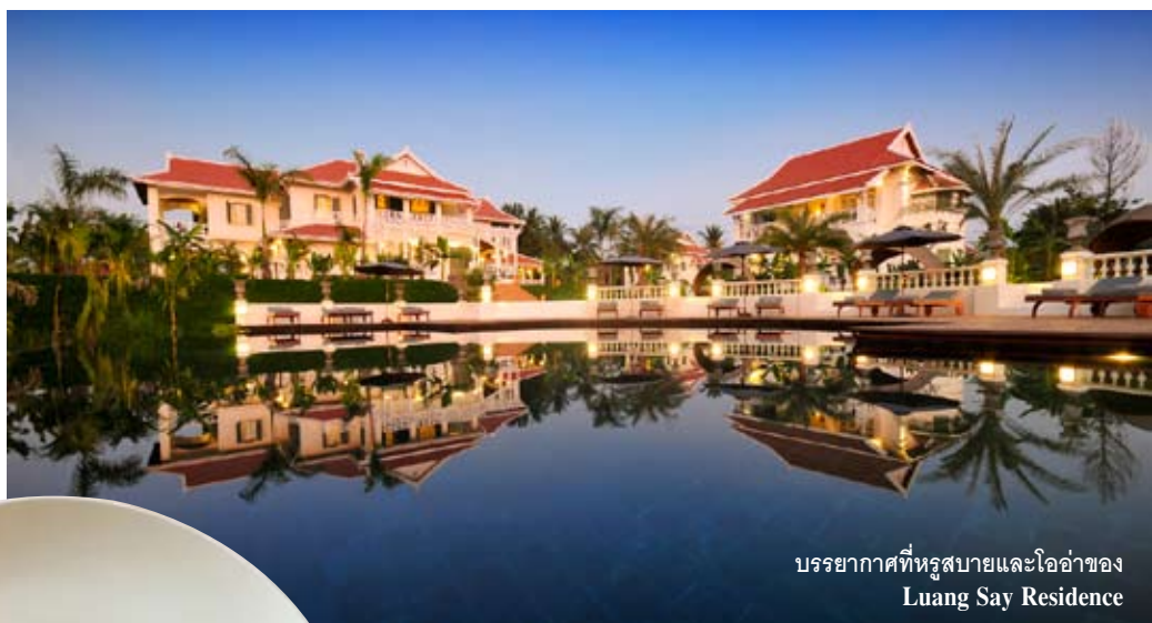
บรรยากาศที่หรูสบายและโอ่อ่าของ Luang Say Residence