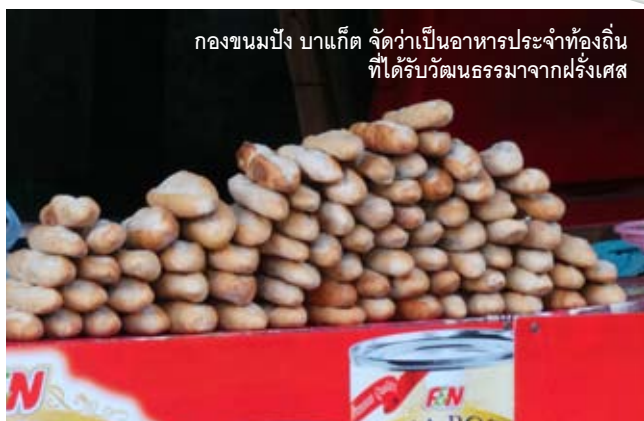
กองขนมปัง บาแกต จัดว่าเป็นอาหารประจำท้องถิ่นที่ได้รับวัฒนธรรมมาจากฝรั่งเศส