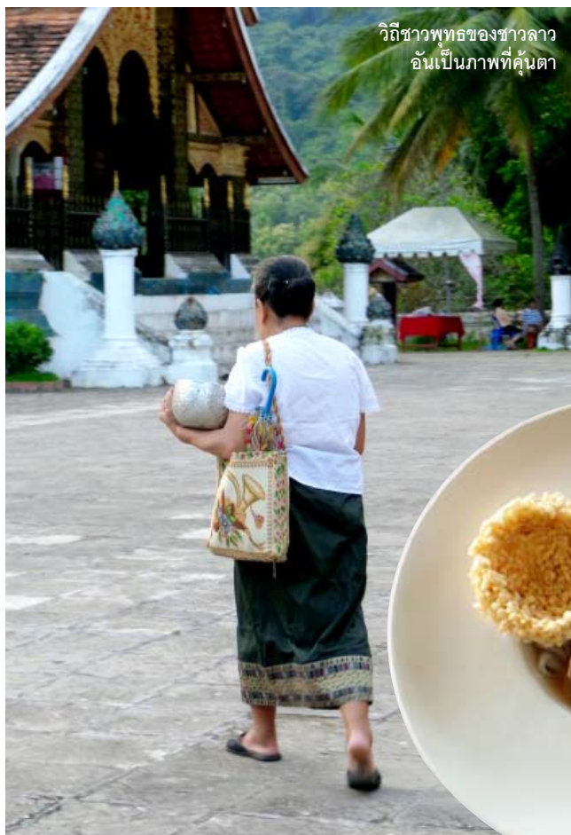
วิถีชาวพุทธของชาวลาว อันเป็นภาพที่คุ้นตา