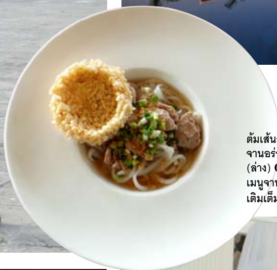
ต้มเส้นอาหารพื้นบ้าน จานอร่อยในโรงแรม (ล่าง) Chef Pong กับเมนูจานเก่าที่มาช่วยเติมเต็มวันพักผ่อน

กิโลเมตร คุณจะพบกับความสวยงามเป็นธรรมชาติ ตอนกลางคืนก็ไปซื้อป๊อปปิ้งที่ถนนคนเดินหรือไนท์มาร์เก็ต สนุกสนานกับการซื้อของฝาก หลังดินเนอร์แวะดื่มและสนุกในแหล่งบันเทิงกับการเดินจิ้งหะบาทสะหลีบ สนุกแน่นอน