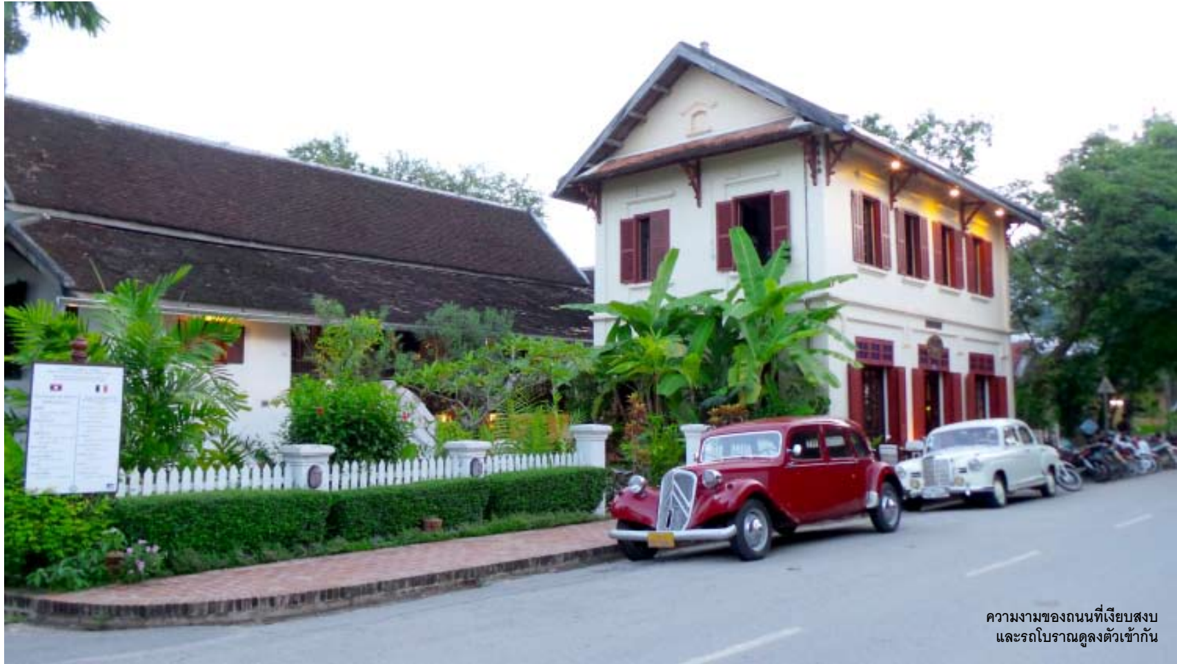
ความงามของถนนที่เงียบสงบ และรถโบราณคู่ลงตัวเข้ากัน